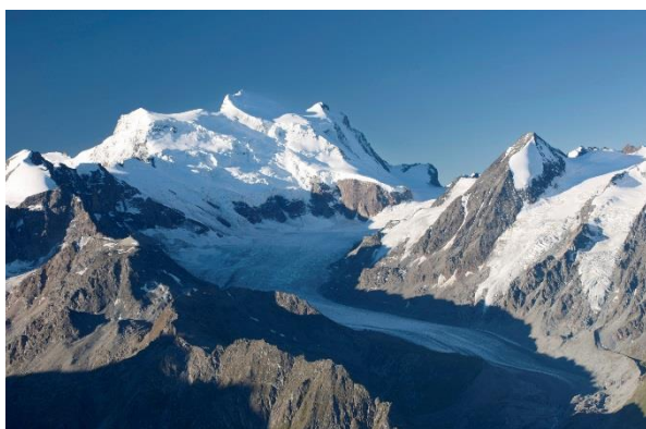
Grand Combin et glacier de Corbassière