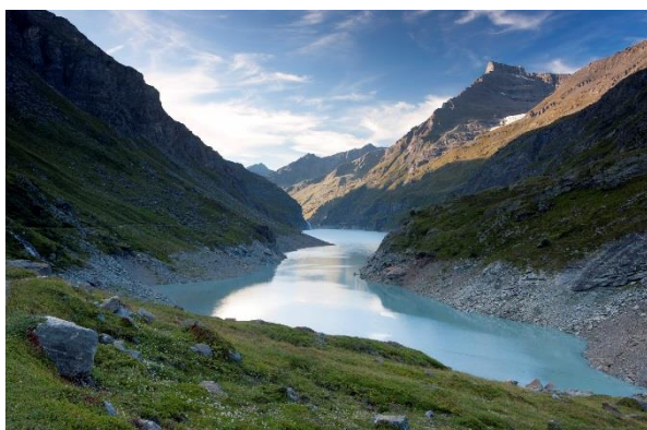
Lac de Mauvoisin