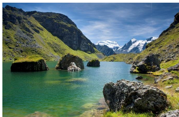
Lac de Louvie