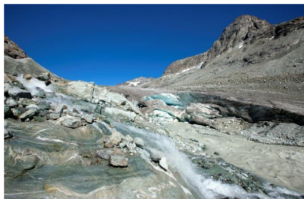
Marge proglaciaire du glacier d'Otemma